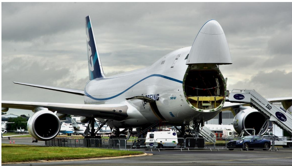
Slika 1: Boeing 747-8 Freighter

Ovdje treba napomenuti kako se veliki dio zrakoplovnih pošiljaka u osnovi prevozi intermodalnim prometom (cestom i zrakom), no one tijekom čitavog prijevoznog puta zadržavaju status zrakoplovne pošiljke, te se pritom za korisnika prijevoza formalno ništa ne mijenja. Aviokompanije koriste cestovni prijevoz na kraćim relacijama (primjerice unutar Europe), posebno između aerodroma s manjim prometom na koje ne slijeću teretni zrakoplovi i svojih matičnih centara robnog prometa, gdje se obavlja transfer s interkontinentalnim letovima za koje se koriste veliki teretni zrakoplovi. Primjerice u i iz Zrakoplovne luke Zagreb, veći dio pošiljaka se doprema i otprema kamionima, a manji dio putničkim zrakoplovima. Tako primjerice Lufthansa održava redovite kamionske linije između Frankfurta i Zagreba. Air France između Pariza i Zagreba, Austrian Airlines između Beča i Zagreba... 16