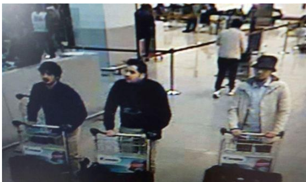
Slika 1. CCTV snimka na kojima se vide Najim Laachraoui (lijevo), Ibrahim El Bakraoui (u sredini) i Mohamed Abrini (desno)

Dva bombaša samoubojice, noseći eksploziv u velikim koferima, detonirali su napravu u dvorani za odlaske na zračnoj luci Bruxelles u Zaventemu. Prva eksplozija dogodila se u 07:58 u check-in redu 11; druga eksplozija dogodila se oko devet sekundi kasnije u check-in redu 2. bombaši samoubojice bili su vidljivi na snimcima CCTV-a. Treći bombaš samoubojica spriječen je u detonaciji vlastite bombe silom prethodne eksplozije. Treća bomba pronađena je u pretrazi aerodroma, a kasnije je uništena kontroliranom eksplozijom. Belgijski savezni tužitelj potvrdio je da su bombaši samoubojice detonirali naprave punjene čavlima. 17 Na snimci kamera za video nadzor zračne luke Bruxelles, čiji prikaz se vidi na slici 1, napadači Ibrahim El Bakraoui, Najim Laachraoui i Mohamed Abrini viđeni su kako guraju kofere za koje se vjeruje da su sadržavali bombe koje su eksplodirale u dvorani za odlazak.