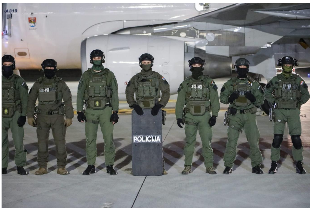
Slika 6. Vježba ATJ Lučko na zračnoj luci u Dubrovniku

Antiteroristička jedinica Lučko, čiji su pripadnici prikazani na slici 6, se prema Zakonu o specijalnoj policiji definira kako slijedi: „ Antiteroristička jedinica Lučko djeluje na cijelom području Republike Hrvatske, a nadležna je za: suzbijanje terorizma, rješavanje najsloženijih otmica i talačkih situacija, otmice zrakoplova i drugih prijevoznih sredstava, posebna osiguranja visokih državnih dužnosnika, suzbijanje najtežih oblika kriminaliteta, uhićenje počinitelja najtežih kaznenih djela, zaštitu određenih osoba, helikopterske operacije, zadaće potraga i spašavanja, snajperske operacije, pronalaženje, deaktiviranje i uništavanje formacijskih i improviziranih eksplozivnih naprava na zemlji i pod vodom, ronilačke intervencije te obavlja i druge poslove sukladno Zakonu o policiji. “ 71