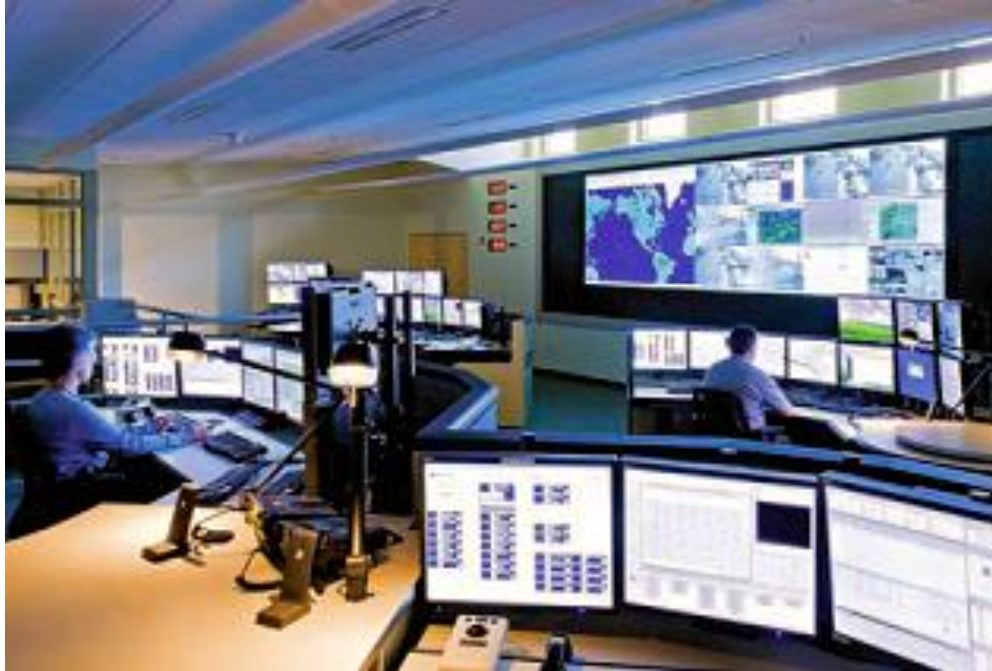
Slika 4. Operativni centar, [14]