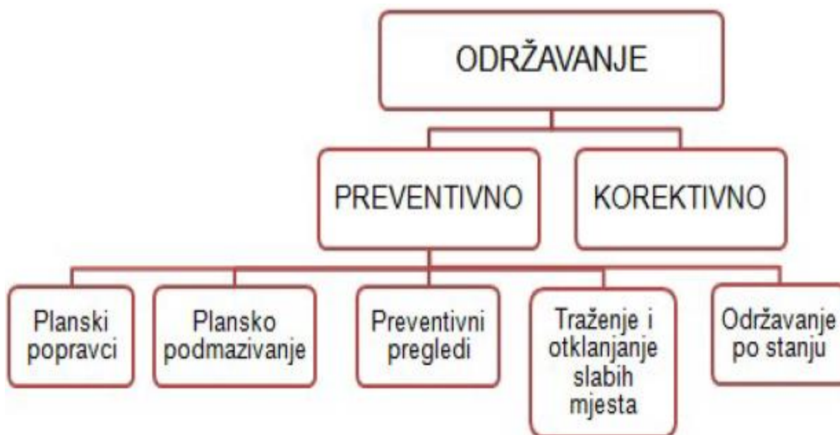
Slika 3.3. Podjela održavanja