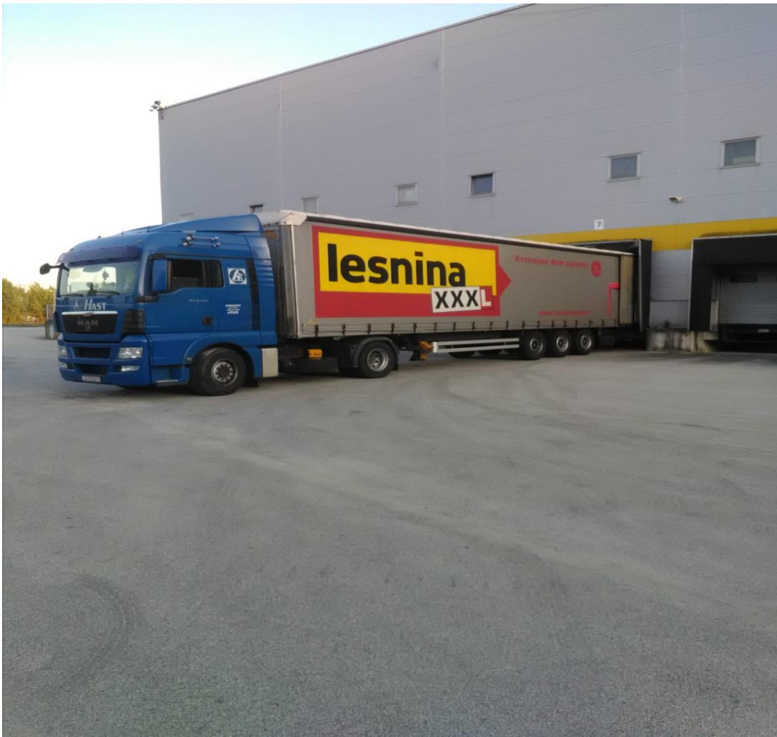
Slika 2.3. Utovar robe na skladištu Lesnine

Generalni su zastupnik za Lesninu i glavni su prijevoznik za svu njezinu robu.