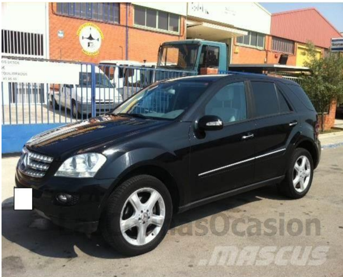
Slika 4.2. Osobno vozilo marke Mercedes ML