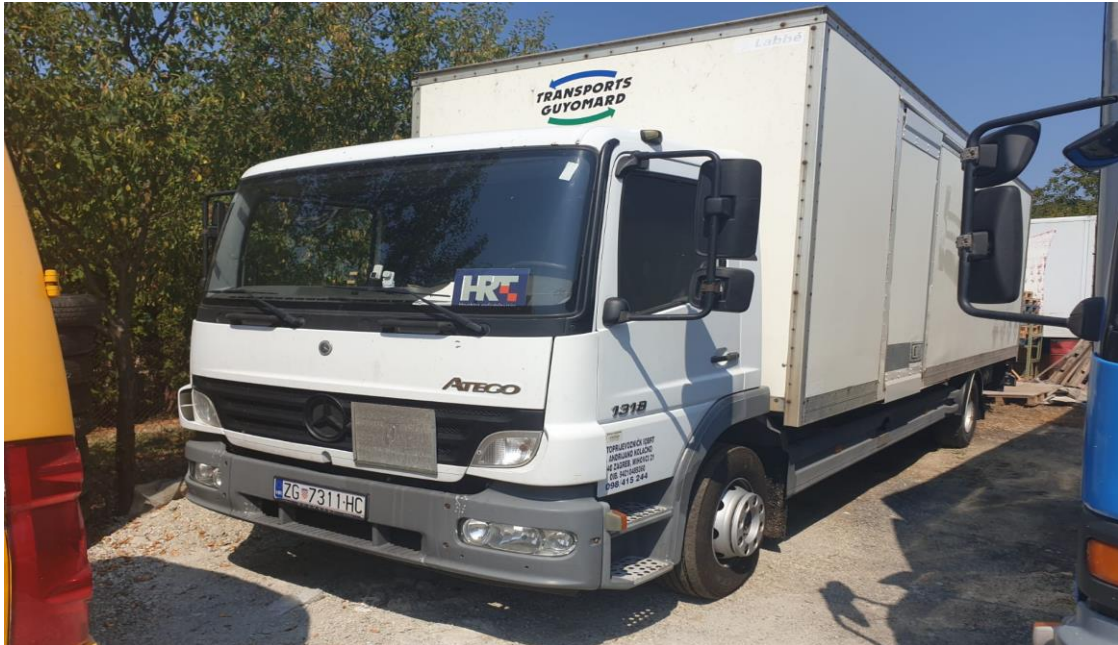
Slika 4.3. Teretno vozilo marke Mercedes Atego

Teretna vozila ne računajući dva osobna vozila firme predstavljaju vojni park tvrtke Autoprijevoznik Kolačko. Teretna vozila su marke Mercedes, Man i ford.