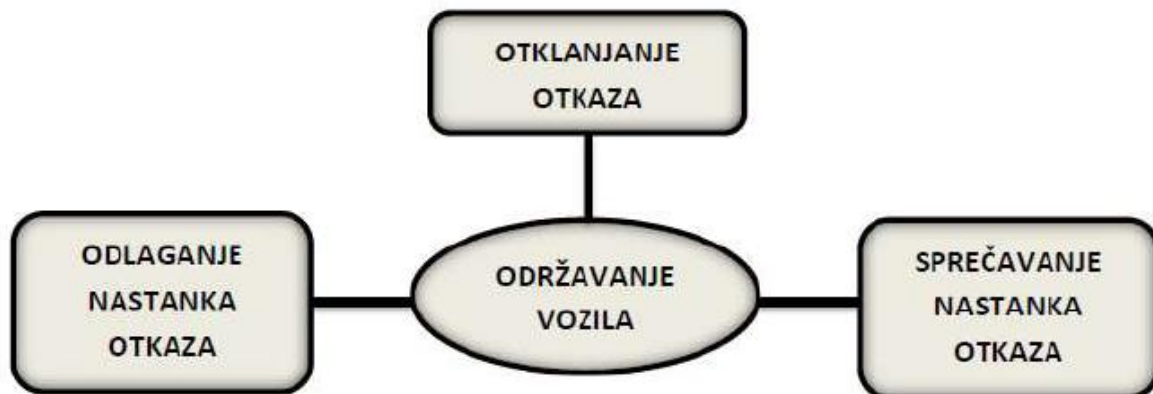
Slika 3.1. Održavanje vozila

Održavanje je složeni organizacijsko-tehnološki sustav gdje svaki element sustava ima vlastite karakteristike i parametre stanja. Elementi sustava su međusobno povezani i ovise jedan o drugom, definirani su ograničenjima, od kojih su najvažniji maksimalno dozvoljeni troškovi održavanja. Dvije karakteristične koncepcije održavanja su preventivni i korektivni postupci. Značaj preventivnih postupaka je zadržati vozilo u ispravnom stanju, dok korektivni postupci imaju zadaću neispravno vozilo dovesti u ispravno stanje (slika 3.1.). [3]