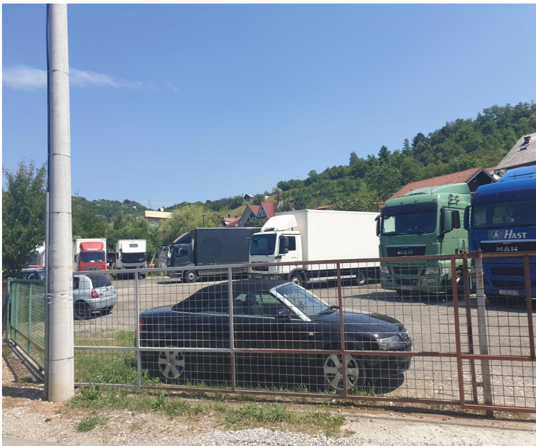
Slika 2.1. Sjedište i parking tvrtke Autoprijevoznik Kolačko

Njegova upornost i zajednički rad sa obitelji rezultirao je širenjem voznog parka i zapošljavanjem 10-tak zaposlenika. Danas voze za poznate salone namještaja, od kojih je LESNINA d.o.o. najveća. Firma se prostire na dvije lokacije prva lokacija je ulica Vladimira Nazora 46, Čačinci a druga lokacija je Mihovci 21, Zagreb (slika 2.1). Na lokaciji Mihovci 21 je smješten parking za sva vozila, a u Čačincima je smještena firma iz koje se vozila šalju na lokacije po potrebi. Autoprijevoznik Kolačko ne bavi se striktno samo prijevozom tereta nego i montažama namještaja koji prevoze za LESNINA d.o.o.