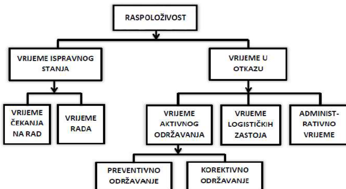
Slika 3.2. Vremenska slika stanja

Vrijeme čekanja na rad se može zanemariti za sustave koji se kontinuirano koriste. Vrijeme u radu označava da vozilo funkcionira zadovoljavajuće, odnosno da obavlja svoje zadatke bez zastoja. Kod vremena aktivnog održavanja, odnosno popravka, vrši se procjena kvara, dijagnoza kvara, popravljivanje istog te provjera spremnosti za rad. Ono može biti preventivno i korektivno održavanje. U logističkom vremenu se podrazumijeva vrijeme čekanja na rezervne dijelove, opremu za održavanje, transportiranje i sl. Za vrijeme logističkog zastoja se ne vrši popravak. Administrativno vrijeme podrazumijeva organizacijske poslove kao što su izdavanja radnih naloga za popravak, čekanje zbog manjeg prioriteta, štrajk i sl. Općenito raspoloživost se može definirati kao odnos prosječnog vremena u radu i ukupnog promatranog vremena, a može biti inherentna, dostignuta i operativna (slika 3.2.). [3]