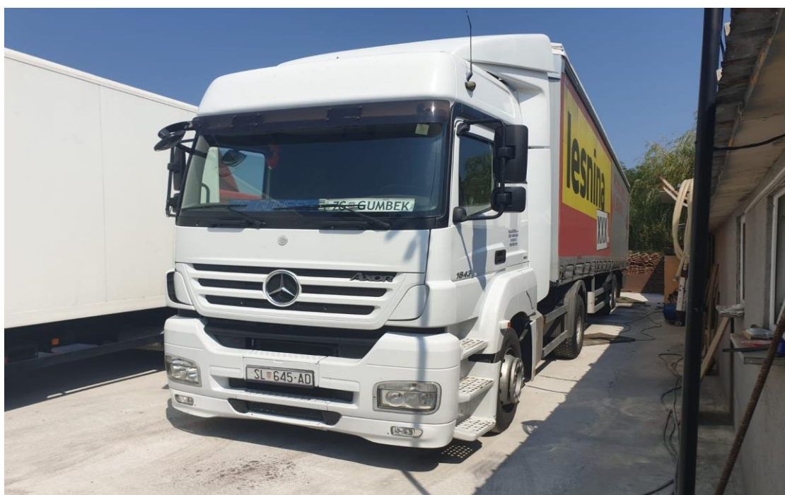
Slika 4.6. Teretno vozilo marke Mercedes Axor