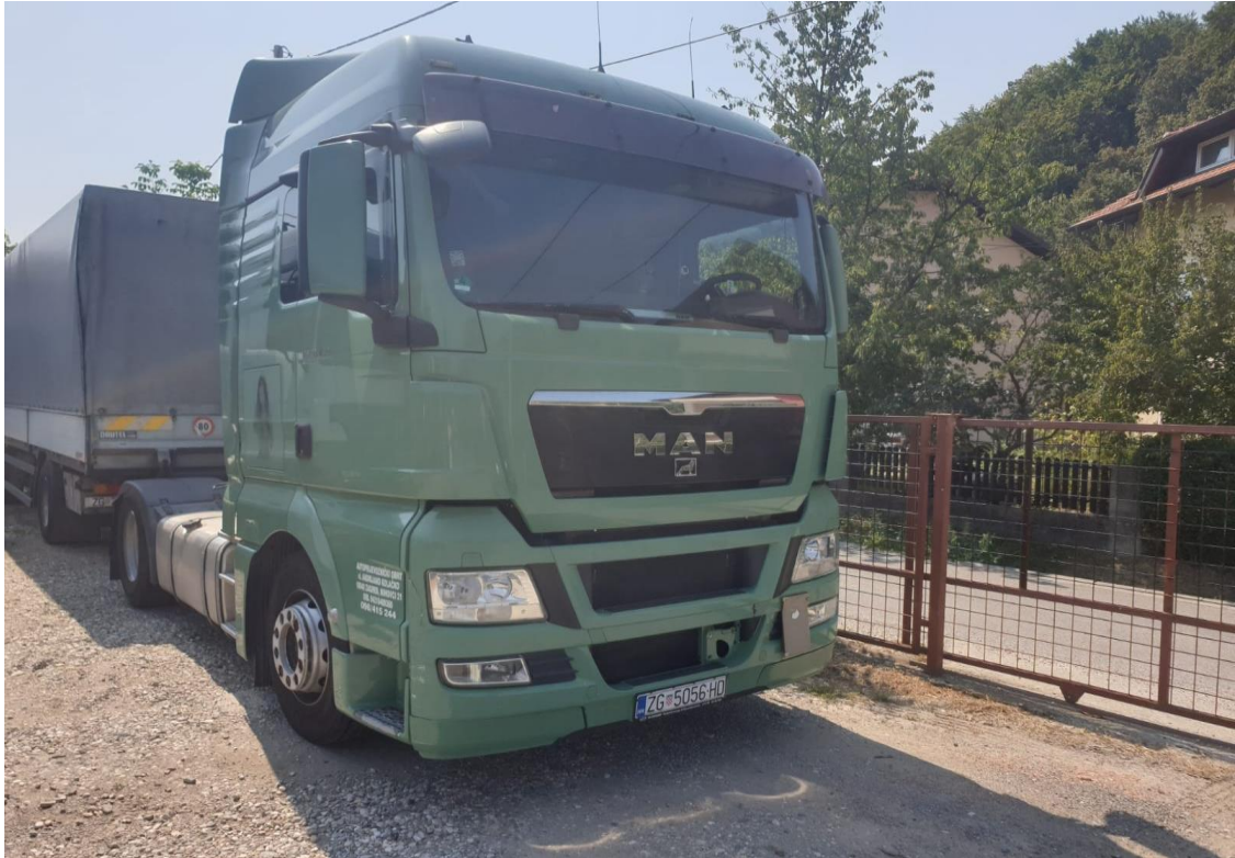
Slika 4.7. Teretno vozilo marke MAN TGA