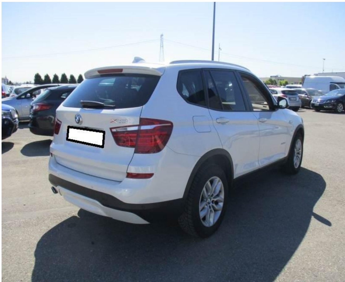
Slika 4.1. Osobno vozilo marke BMW

Tvrtka broji dva osobna vozila jedno vozilo je marke BMW a drugo marke Mercedes, vozila su registrirana na poslovnicu u Čačincu. Navedena vozila koriste vlasnici firme u slučaju nekakvog problema na teretnim vozilima i u slučaju zastoja nekog vozila van grada Zagreba za brži i lakši dolazak do lokacije i prebačaj vozača do firme.