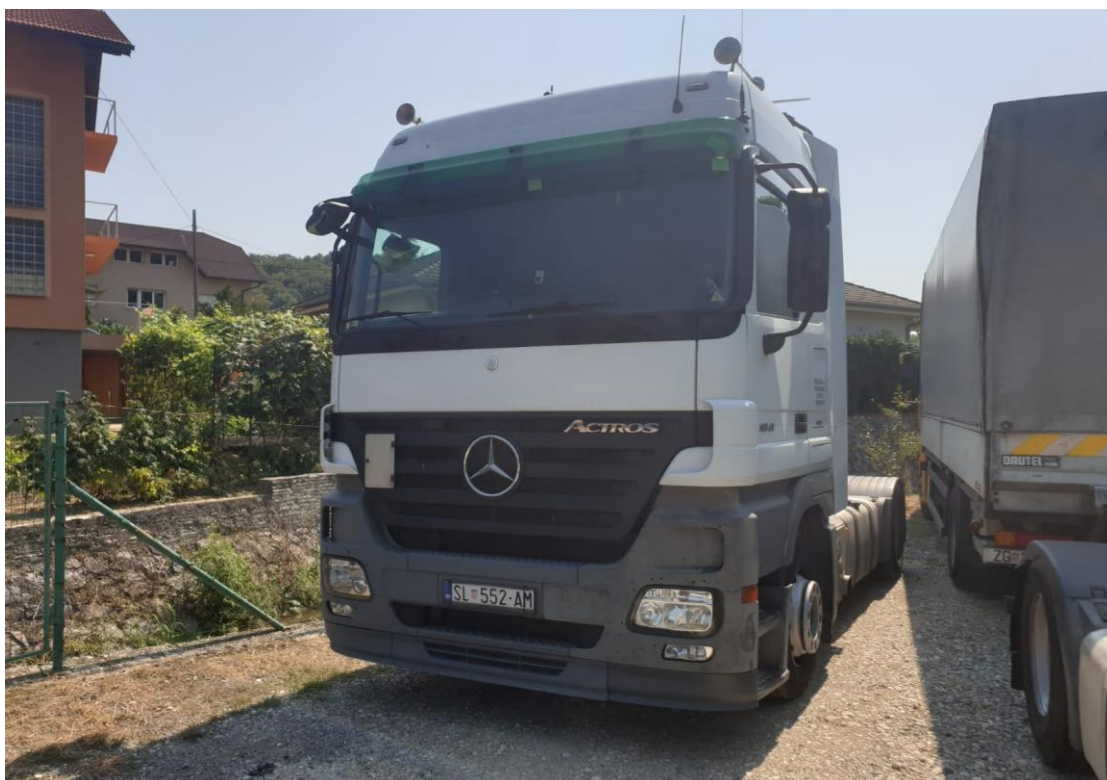
Slika 4.5. Teretno vozilo marke Mercedes Actros