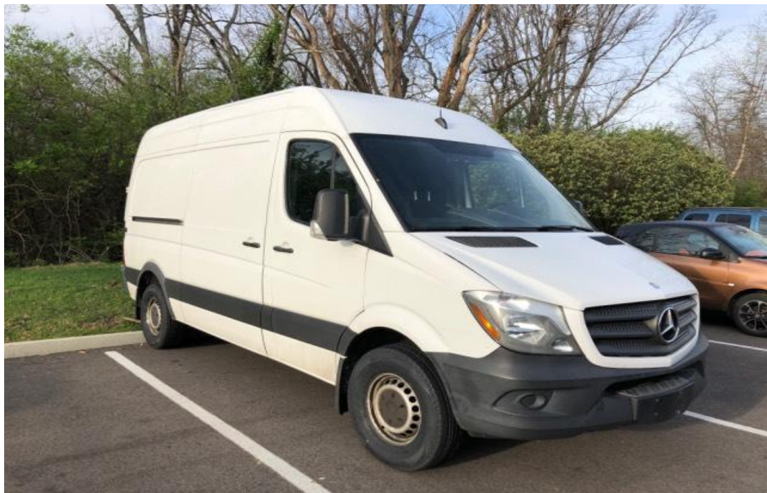
Slika 4.4. Teretno vozilo marke Mercedes Sprinter