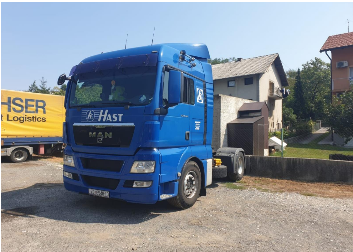
Slika 4.8. Teretno vozilo marke MAN TGX