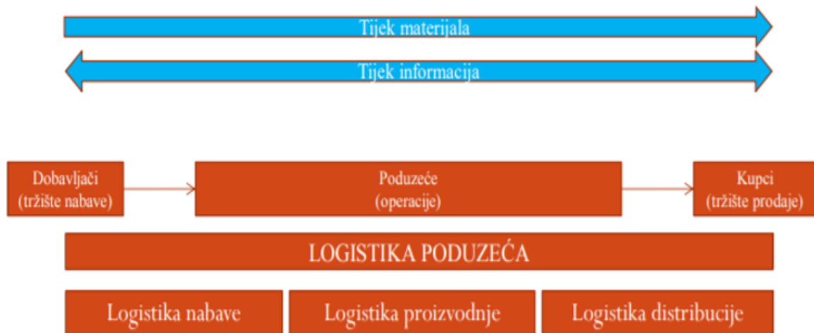
Slika 3. Prikaz dijelova logistike poduzeća

Logistika poduzeća definira se kao integrirano planiranje, izvršavanje, kontrola i upravljanje svim internim i eksternim tokovima robe i informacija pod odgovornošću poduzeća. Ukoliko promatramo osnovni tijek materijala vidljivo je da oni prolaze tri funkcionalne logistike : logistika nabave, logistika proizvodnje i logistika distribucije. 31