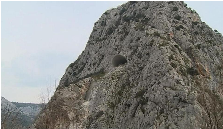
Slika 7. Tunel u Omišu namijenjen za gradnju brze ceste Omiš-Trogir.[20]

Hrvatske ceste zajedno s jednom od prijašnjih Vlada Republike Hrvatske su pokušale riješiti problem kilometarskih kolona na dionici D8 državne ceste planom izgradnje brze ceste na području od Omiša do Trogira. Hrvatske ceste u ljeto 2006. godine počele su s izgradnjom pedesetak kilometara duge četvertračne brze ceste. Vrijednost projekta bila je 200 milijuna eura. Izgradnja brze ceste Trogir -Omiš trebala se odvijati u tri faze - od Trogira do Solina, zatim od Stobreča do Dugog Rata, te od tog mjesta do istočnog izlaza iz Omiša. Cesta je trebala ići južnom padinom Mosora, iznad Podstrane, Jesenica i Duća s četiri raskrižja. Na slici 7.prikazan je tunel koji bi trebao biti dio brze ceste Omiš-Trogir, ali radovi trenutno stagniraju. Nakon uvodnih radova te početka gradnje naglo je cijeli projekt obustavljen, te i danas 12 godina nakon početka gradnje, brza cesta još nije završena.