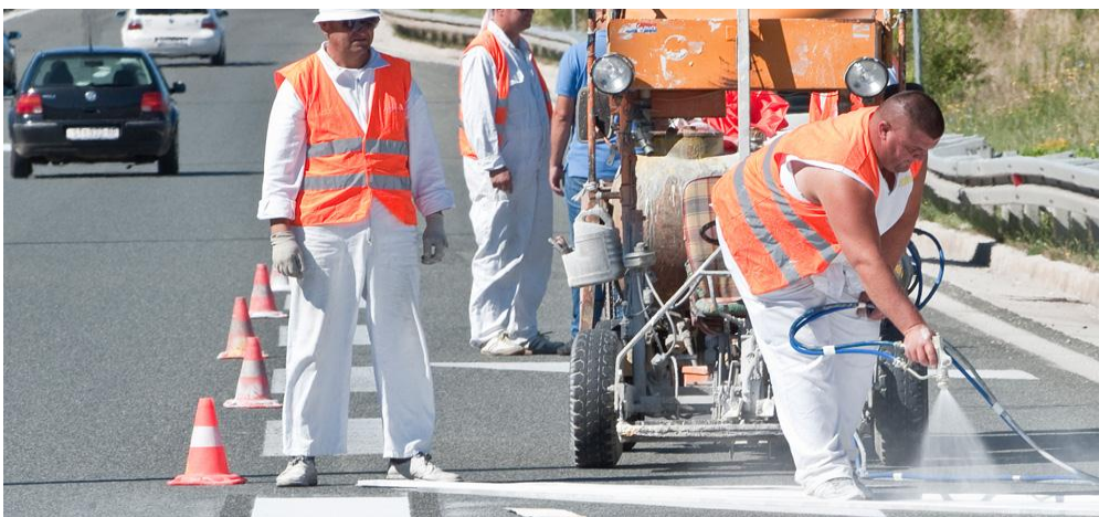
Slika 5. Održavanje ceste - Iscrtavanje horizontalne signalizacije na cesti DC 1/17 rotor Podi Dugopolje[16]

Na dijelovima ceste, na kojima se u toku godine obavi obnova kolnika, oznake na kolniku moraju se povući odmah nakon obnove (slika 5.). [15]