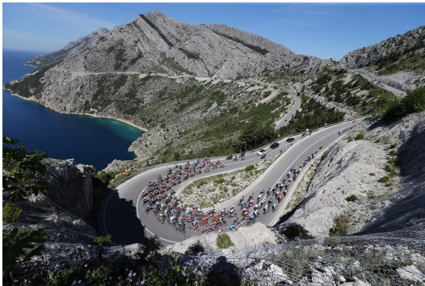
Slika 3. Konfiguracija terena na državnoj cesti D8 u blizini Makarske.[5]

Prostorni raspored javnih cesta u izravnoj je vezi s konfiguracijom terena (reljefom), naseljenošću ali na njega utječu i druge prilike (klimatske, geološke, ekološke). Jedna od glavnih poveznica županije uz autocestu je i državna cesta D8, poznata kao Jadranska magistrala koja najvećim djelom prolazi uz priobalje. Na velikom djelu uz obalu konfiguracija je terena vrlo pristupačna, te se pruža prekrasan pogled na otoke. Na slici 3. uočava se način prostornog vođenja trase, njeno prilagođavanje terenskim prilikama, ali atraktivnost okoliša kojim prolazi. Izgradnja dionice od Šibenika do granice sa Crnom Gorom trajala je od 1963. do 1965. godine, te je za to vrijeme izgrađen 291 kilometar na dotad nepristupačnom terenu, a dugo je vremena bila jedina poveznica naselja uz obalu.