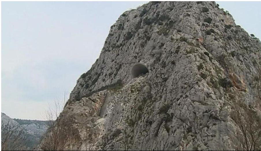
Slika 7. Tunel u Omišu namijenjen za gradnju brze ceste Omiš-Trogir.[20]

Hrvatske ceste zajedno s jednom od prijašnjih Vlada Republike Hrvatske su pokušale riješiti problem kilometarskih kolona na dionici D8 državne ceste planom izgradnje brze ceste na području od Omiša do Trogira. Hrvatske ceste u ljeto 2006. godine počele su s izgradnjom pedesetak kilometara duge četvertračne brze ceste. Vrijednost projekta bila je 200 milijuna eura. Izgradnja brze ceste Trogir -Omiš trebala se odvijati u tri faze - od Trogira do Solina, zatim od Stobreča do Dugog Rata, te od tog mjesta do istočnog izlaza iz Omiša. Cesta je trebala ići južnom padinom Mosora, iznad Podstrane, Jesenica i Duća s četiri raskrižja. Na slici 7.prikazan je tunel koji bi trebao biti dio brze ceste Omiš-Trogir, ali radovi trenutno stagniraju. Nakon uvodnih radova te početka gradnje naglo je cijeli projekt obustavljen, te i danas 12 godina nakon početka gradnje, brza cesta još nije završena.