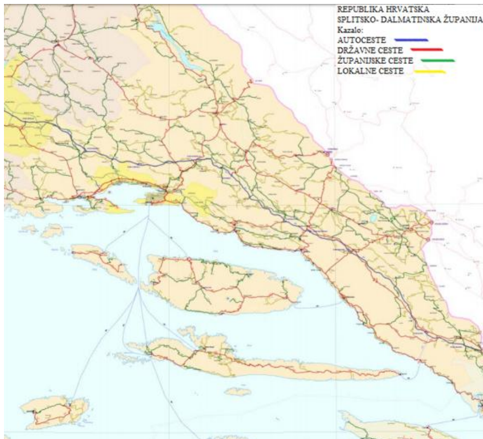
Slika 2. Prikaz mreže javnih cesta u Splitsko-dalmatinskoj županiji.[4]

Izvori financiranja javnih cesta određeni su Zakonom o cestama. Glavni izvor financiranja za upravitelje mreže autocesta, HAC (Hrvatske autoceste) predstavlja naplata cestarine. Na svim dionicama autoceste na području županije u primjeni je zatvoreni sustav naplate, kod kojeg je cijena cestarine razmjerna prijeđenom putu. HAC se djelomično financira i iz dijela trošarina za gorivo koji se izdvaja za cestovni sektor, a veći dio tih trošarina predstavlja glavni izvor prihoda za HC (Hrvatske ceste).