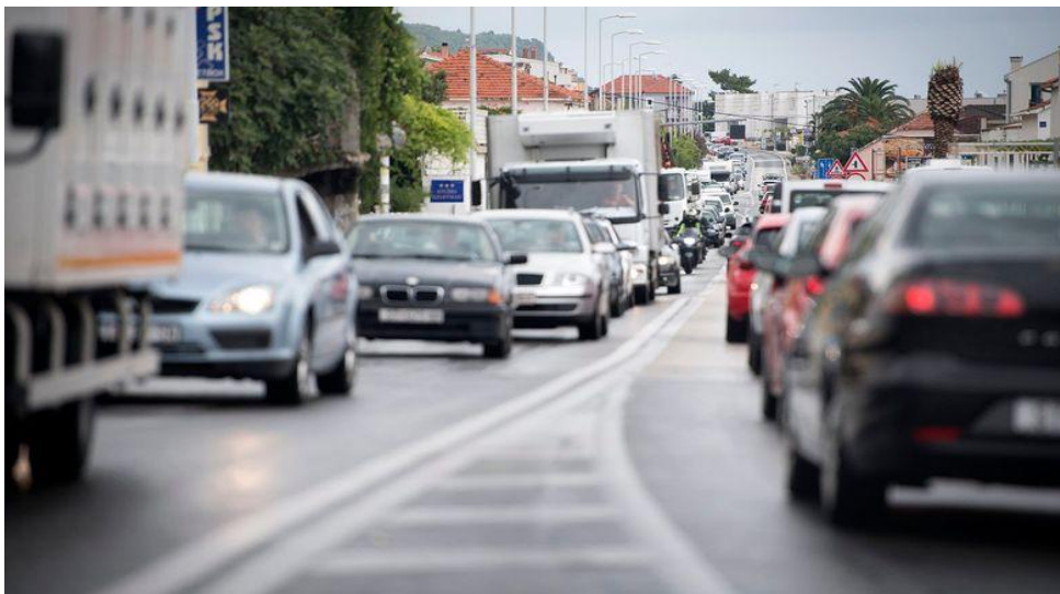
Slika 6. Prometna gužva na Jadranskoj magistrali u mjestu Dugi Rat, između Omiša i Splita.[20]

Za vrijeme ljetnih mjeseci ističe se problem preopterećenja cesta i Jadranske magistrale na području od ulaza u Omiš, pa sve do ulaza u Split. Tim potezom dnevno u ljetnim mjesecima prođe do 25 tisuća vozila. Kolona vozila je vrlo često prelazi 20 kilometara. Jadranska magistrala jednostavno ne može primiti toliko veliki broj vozila, te se iz tog razloga stvaraju gužve i zastoji. Problem gustoće prometa na spomenutoj dionici datira još iz prošlog stoljeća. S godinama ovaj je problem postajao sve veći. Cesta, koja je već 1990. godine bila zastarjela, ostale do danas glavna prometnica na dugom i ljeti pretrpanom potezu između Splita i Omiša.