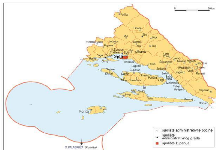
Slika 1. Položaj Splitsko-dalmatinske županije. [2]

Županiju s ostatkom Hrvatske povezuje nedavno sagrađena autocesta Split-Zadar-Karlovac-Zagreb s četiri prometna traka, kao i lička željeznica. Međunarodna zračna luka Split-Kaštela koristi se uglavnom za turističke letove ljeti, a postoji i manja međunarodna zračna luka na otoku Braču, te letjelišta u Sinju i na otoku Hvaru. Otoci su slabo nastanjeni, ekonomski su razvijeniji od zaobalja, međutim zbog različitih prilika imali su trajnu emigraciju stanovnika. Otočni dio županije sastoji se od 745 otoka, te 57 hridi i grebena. Svojom veličinom i naseljenošću izdvaja se 5 otoka, a to su Brač, Hvar, Čiovo, Šolta i Vis, a još su naseljeni Veli Drvenik, Mali Drvenik, Sv. Andrija, Biševo i Šćedro. Splitsko-dalmatinska županija se nalazi u zoni jadranskog tipa mediteranske klime čije su osnovne karakteristike suha i vruća ljeta te blage zime. Krećući se od otočnog preko obalnog do zaobalnog područja, srednje godišnje temperature opadaju, a povećava se ukupna količina oborina. Prevladavajući vjetrovi su bura i jugo čija učestalost iznosi 35 do 55% godišnje. Jadransko more kao prirodni rezervoar relativno tople vode s temperaturom od 10 do 26°C najvažniji je indikator klimatskih karakteristika na području županije.[1]