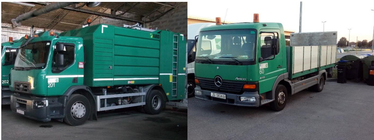
Slika 4. Lijevo prikaz vozila marke Renault za pranje posuda, a desno vozilo za distribuciju posuda

Vozila za pranje posuda imaju ukupnu masu 18 tona, dok vozila za distribuciju tih posuda imaju ukupnu masu 4600 ili 7490 kilograma.