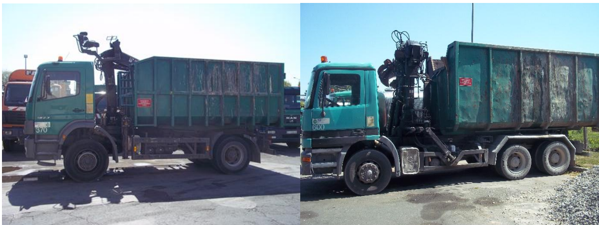
Slika 6. Kiper s dizalicom (utovarnom rukom), lijevo s dvije osovine, desno s tri