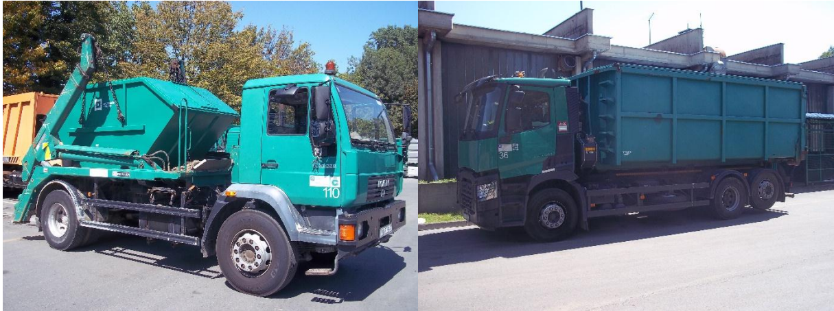
Slika 5. Lijevo slika auto podizača, a desna roll kiper s tri osovine