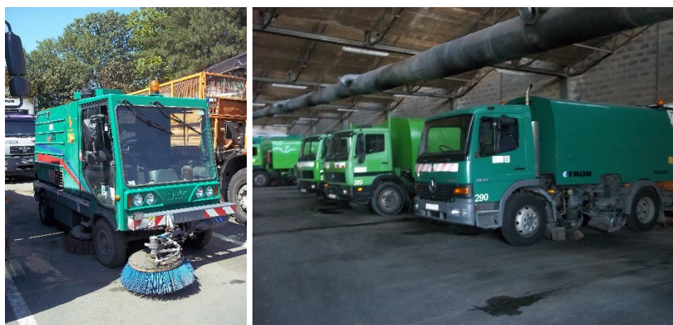
Slika 8. Slika lijevo mala čistilica, slika desno velike čistilice

Također u tu skupinu ubrajaju i male i velike čistilice. Kod malih čistilica ukupna masa je od 3550 do 10500 kilograma, a velike čistilice imaju ukupnu masu 13, 14 ili 15 tona.