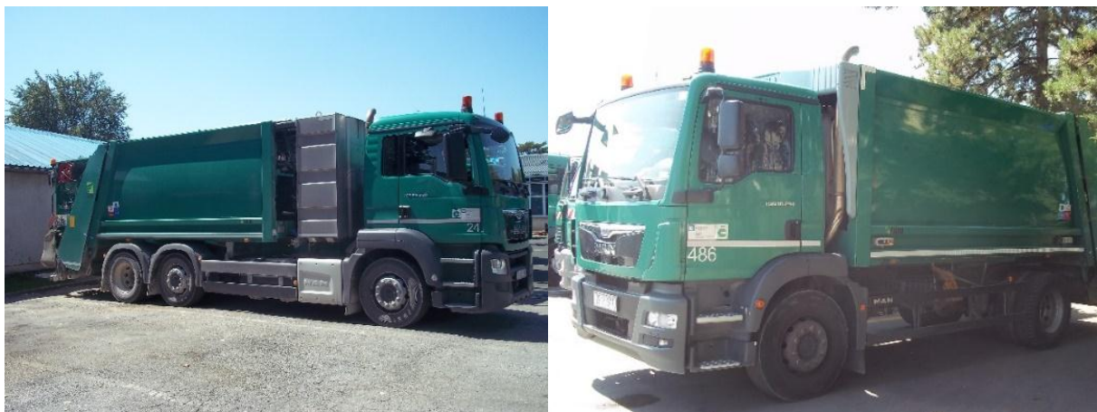
Slika 2. Vozila marke MAN za odvoz otpada iz domaćinstava i od ostalih korisnika

Kod vozila za odvoz otpada, takozvanih smećara, ukupna masa kreće se od 11 pa sve do 26 tona.