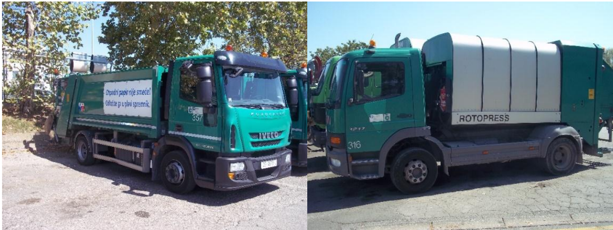
Slika 3. Vozila za odvoz otpada iz domaćinstva marke IVECO i Mercedes

osovine. Slika 3. dolje lijevo je vozilo marke IVECO, a desno vozilo marke Mercedes, također s dvije osovine.