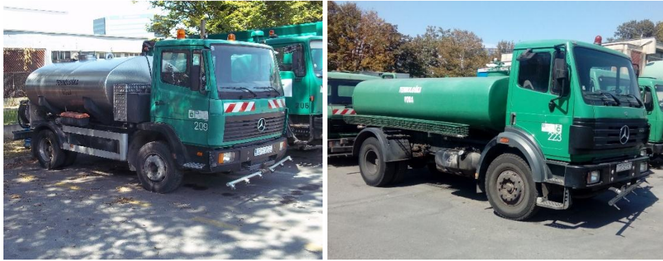
Slika 9. Cisterna lijevo 5m 3 , a desno 7m 3