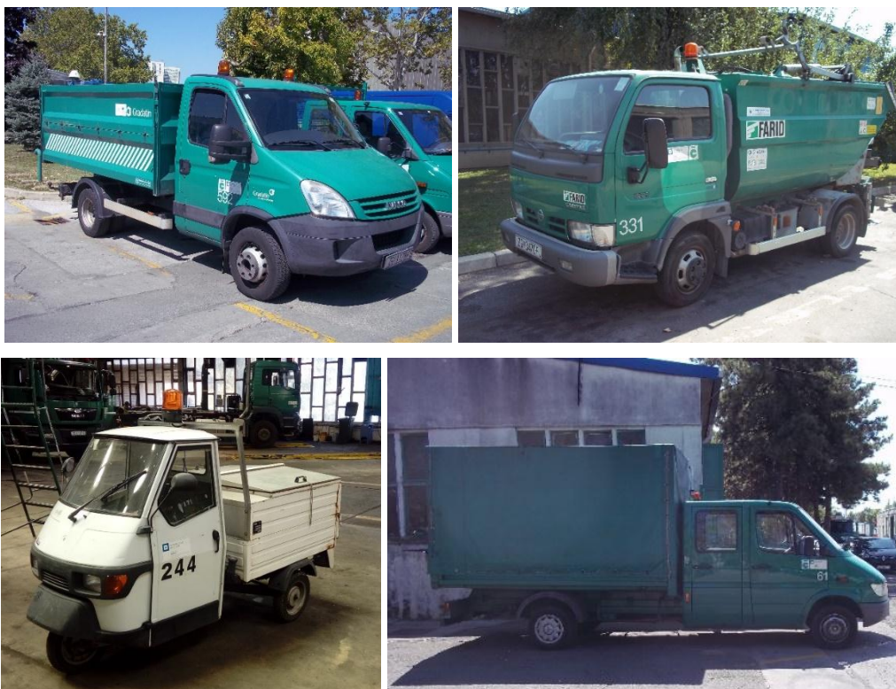
Slika 7. Cestari raznih veličina i nosivosti