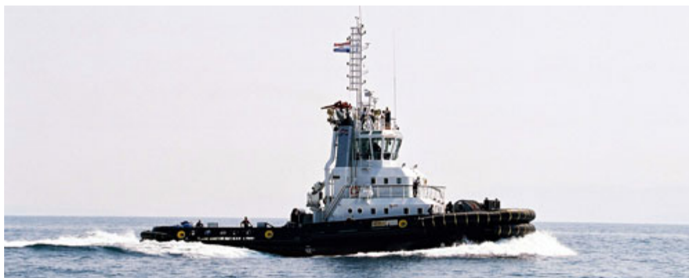
Slika 5. Tegljač Gea broдача Jadranski pomorski servis

Započinje sa radom 1956. godine, a dioničkim društvom postaje 1994. godine. Pruža usluge tegljenja, spašavanja, dizanja teških tereta pontonskom dizalicom, prijevoza nafte i naftnih derivata, a među osnovnim djelatnostima nalazi se i ekološka zaštita mora. Važan je čimbenik sigurnosti plovidbe na području sjevernog Jadrana, a najčešće intervenira pri odsukavanju nasukanih plovila, gašenju požara na brodovima i tegljenju onesposobljenih plovila do luka. Upravlja sa 11 tegljača, tri teglenice te jednom pontonskom dizalicom, ukupne tonaže 4907 GT i 3178 DWT.