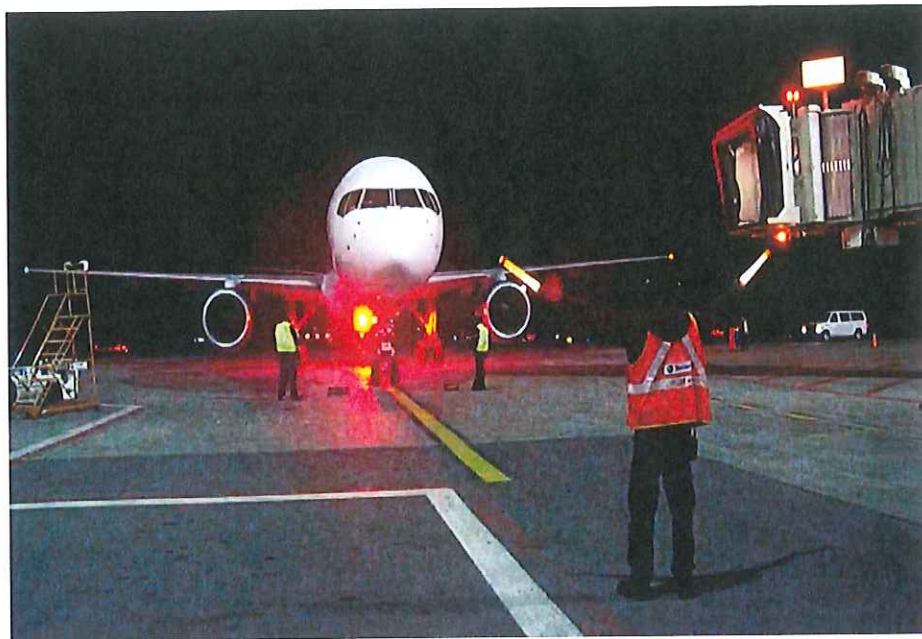
Slika 3. Prikaz navođenja zrakoplova na poziciju u noćnim uvjetima, [16].

Sustav navođenja zrakoplova na poziciju od strane parkera predstavlja primitivniji način navođenja zrakoplova za koji je potrebna i dodatna radna snaga. Naime, u trenutku kada zrakoplova izađe iz nadležnosti aerodromske kontrole preuzima ga parker (ukoliko postoji na zračnoj luci) koji uz pomoć vozila navodi zrakoplov na određenu poziciju. Kada je zrakoplov u blizini pozicije parker ga ručnim navođenjem uz odgovarajuća sredstva (palice) navodi do točke zaustavljanja. Obuku za parkera može pružiti zračna luka ili treća strana. Signali koje parker koristi moraju biti standardizirani i vidljivi u svim uvjetima kao što je prikazano na slici 3. [13].