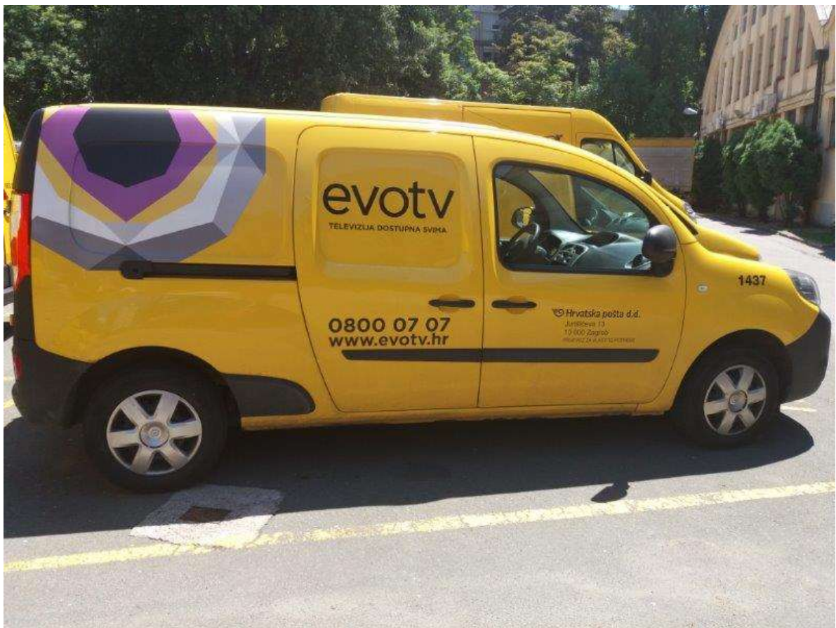
Slika 12. Renault, model Kangoo

Lako dostavna vozila su zatvorenog tipa karoserije s dva sjedala za vozača i suvozača. Ova vrsta vozila pripada kategoriji vozila čija najveća dopuštena masa nije veća od 800 kilograma.