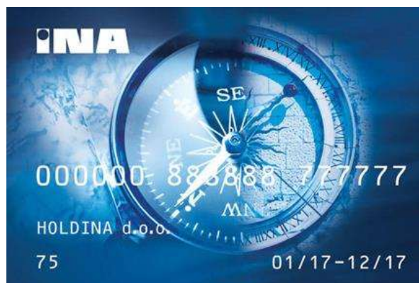
Slika 7. A-INA kartica

A-INA kartica omogućuje njezinom korisniku da nakon uplate sredstava koristi A-INA karticu(e) do visine uplaćenog iznosa na prodajnim mjestima INE i time ostvaruju pravo na R-1 račun, te može planirati svoje poslovanje bez brige o gotovini.