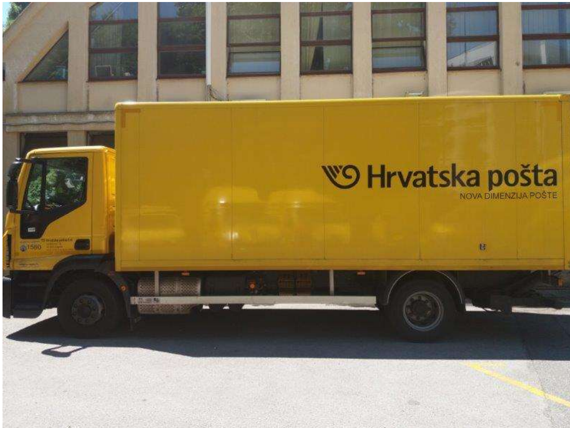
Slika 14. Teretno vozilo-IVECO, model Eurocargo

Kamioni su najopterećenija skupina vozila. Rade najveće kilometraže, prosječno 100 000 kilometara godišnje, a koriste se isključivo za međugradske vožnje.