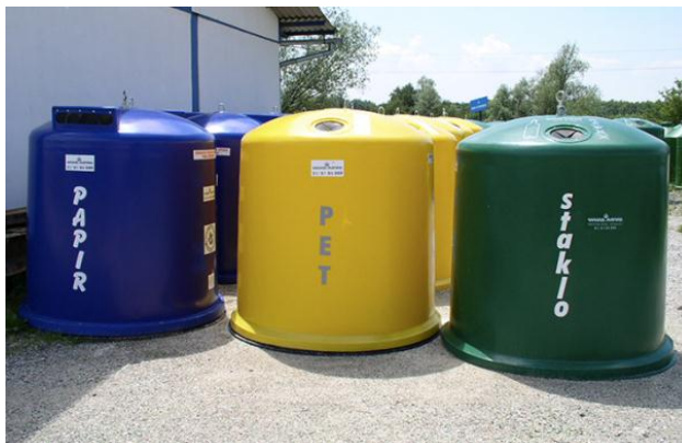
Slika 2 Zvonoliki spremnici