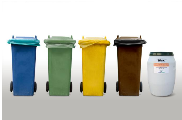
Slika 1 Specijalizirani spremnici