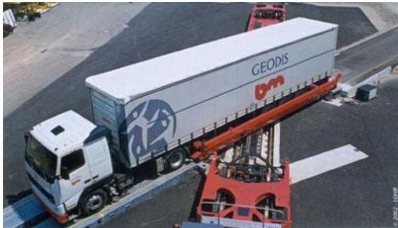
Slika 4. Bočni ukrcaj Modalohr tehnologija