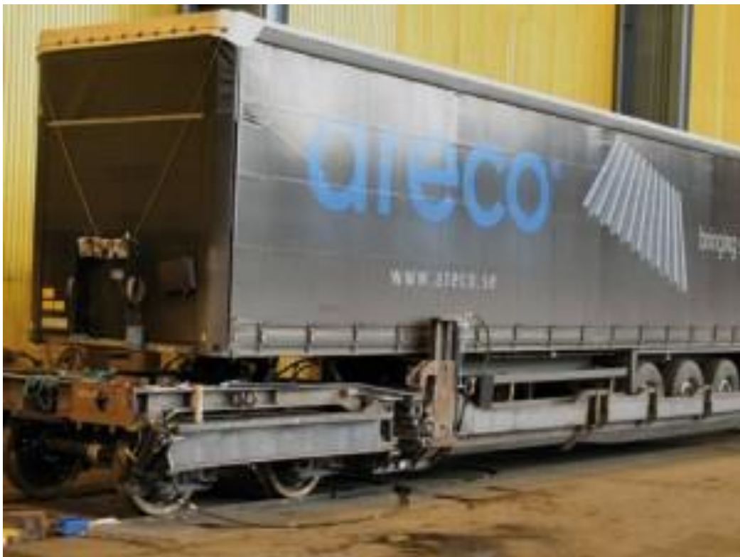
Slika 2. Prikaz tehnologije B

Izvor: http://www.szz.hr/megaswing-vagoni-za-kamionske-prikolice (srpanj, 2017.)