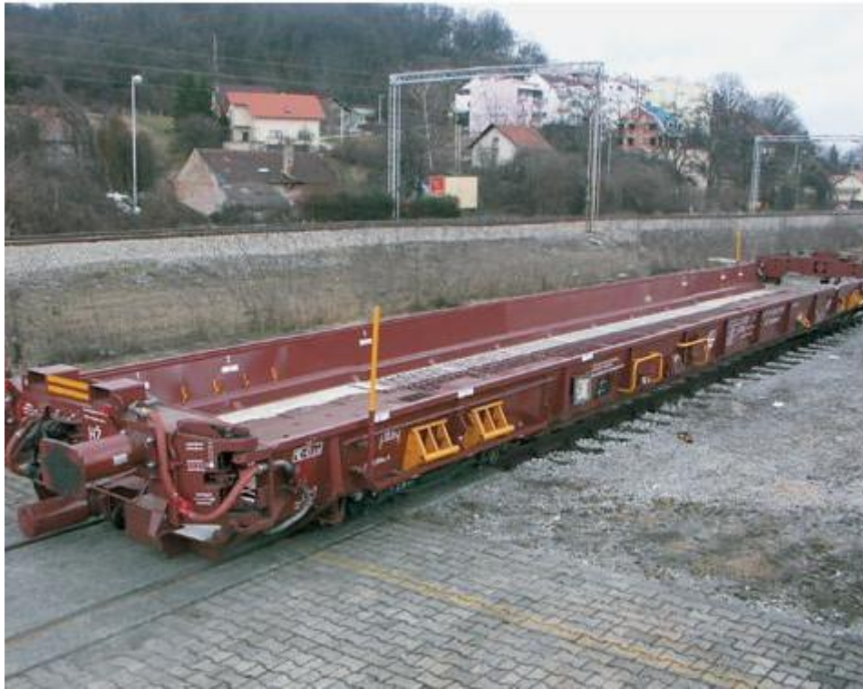
Slika 5. Saadkms vagon u terminalu Vrapče