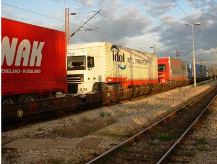
Slika 1. Prikaz Ro - La vlaka