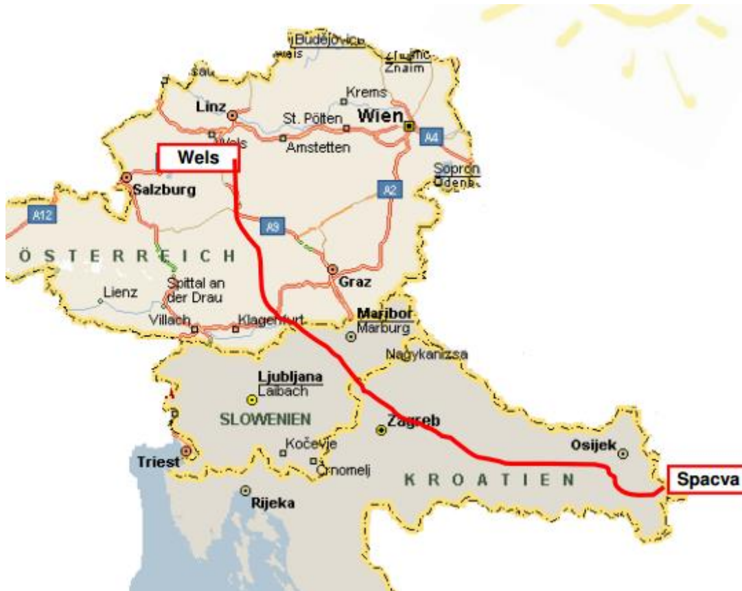
Slika 7. Prikaz željezničke rute Spačva – Wels