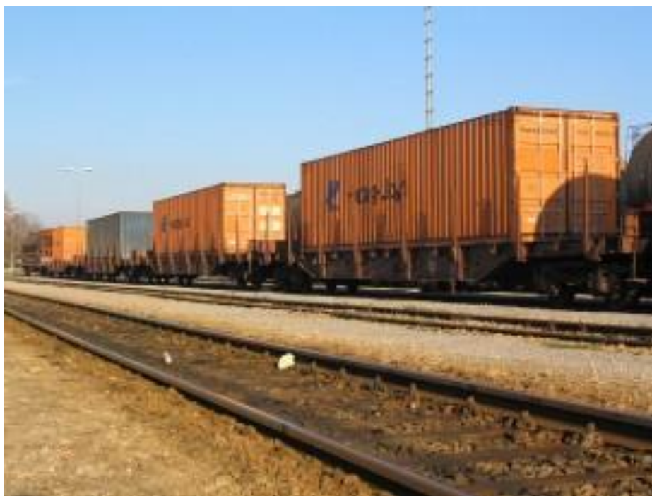
Slika 3. Prijevoz kontejnera vlakom

Izvor: http://www.szz.hr/osnovan-zajednicki-zeljeznicki-prijevoznik-za-prijevoz-izmedu-kine-i-europe (srpanj, 2017.)