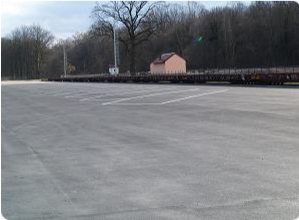
Slika 6. Terminal Spačva

Na terminalu je predviđena izgradnja dvaju odvojenih parkirališta za dolazne i odlazne kamione te izgradnja pratećih objekata za smještaj osoblja i službi koje su neophodne za rad terminala i najmanje 22 parkirališna mjesta za kamione. Izvan granica terminala uz pristupnu cestu planirano je bilo sagraditi i 10 parkirališnih mjesta za kamione koji čekaju u redu za ulazak u terminal.