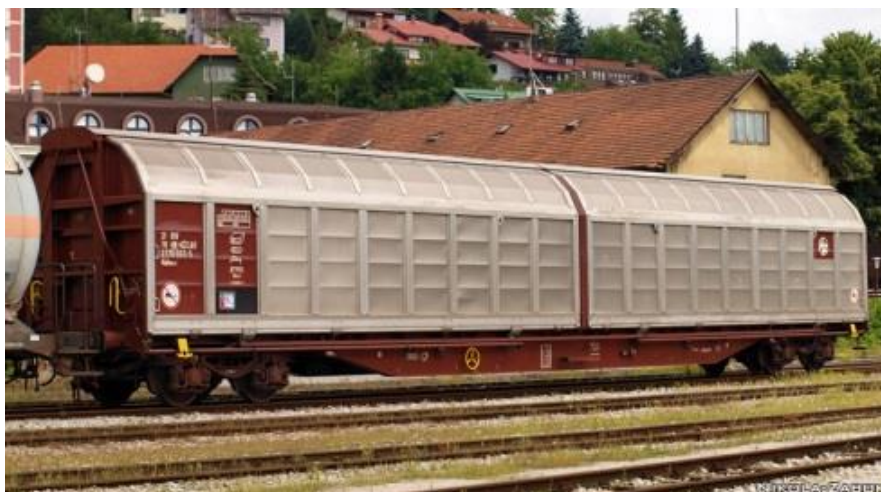
Slika 2.: Vagon serije H, podserija Habbins

Vagoni serije H su specijalni zatvoreni vagoni jer imaju mogućnost otvaranja vrata preko dvije trećine svake bočne stranice njihovim uzdužnim pomicanjem što uvelike olakšava ukrcaj i iskrcaj roba pomoću viličara po cijelom korisnom prostoru vagona, roba koja zahtjeva provjetranje ne može se prevoziti ovim vagonima jer nemaju prostor za provjetranje.