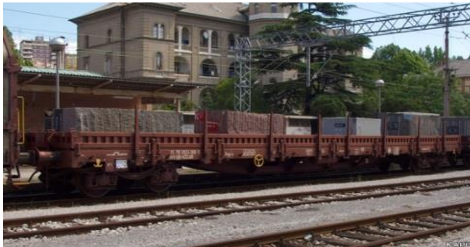
Slika 3.: Vagon serije R, podserija Regs

Serijski R s podserijama (Regs, Rgs, Rils, ...) su obični četveroosovinski plato-vagoni konstrukcijski su velikih dužina i nosivosti, pa su namijenjeni za prijevoz teške komadne robe i kontejnera. Vagoni ove serije mogu biti izvedeni s stupcima, bočnim čelnim stranicama te uređajima za pričvršćivanje kontejnera. Na vagonima s čelnim i bočnim stranicama može se prevoziti roba u rasutom stanju koja ne treba biti zaštićena od atmosferskih utjecaja.