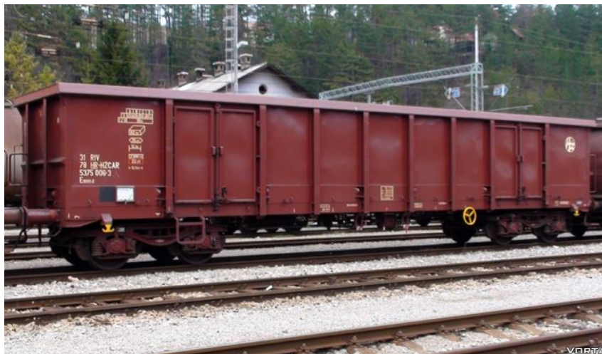
Slika 1.: Vagon serije E, podserija Eanos

prijeklopne stranice ako na vagonima postoje, teret se može zaštititi ceradama (pokrivačima) koji se vežu za ušice na vagonima ugrađene na bočnim i čelnim stranicama.