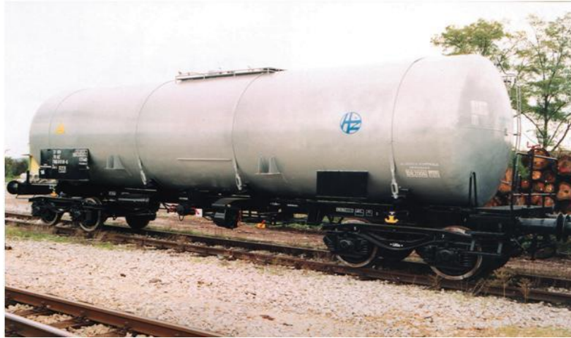
Slika 6.: Vagon serije Z, podserije Zas

Serijski vagoni Z s podserijama (Zas, Zaes, Zagkks, ..) su specijalni zatvoreni vagoni s posudama za tekućine-cisterne, namijenjeni su za prijevoz tekućina bez ambalaže te onih tvari koje na povišenoj temperaturi prelaze u tekuće stanje (mazut, bitumen, parafin i slično). Na vagonima je označeno za koju su tekućinu namijenjeni. To je potrebno zbog toga da se spremnici vagona ne moraju prati ako se njima prevozi ista vrsta tekućine. 2 Izvode se kao dvoosovinski i četveroosovinski.