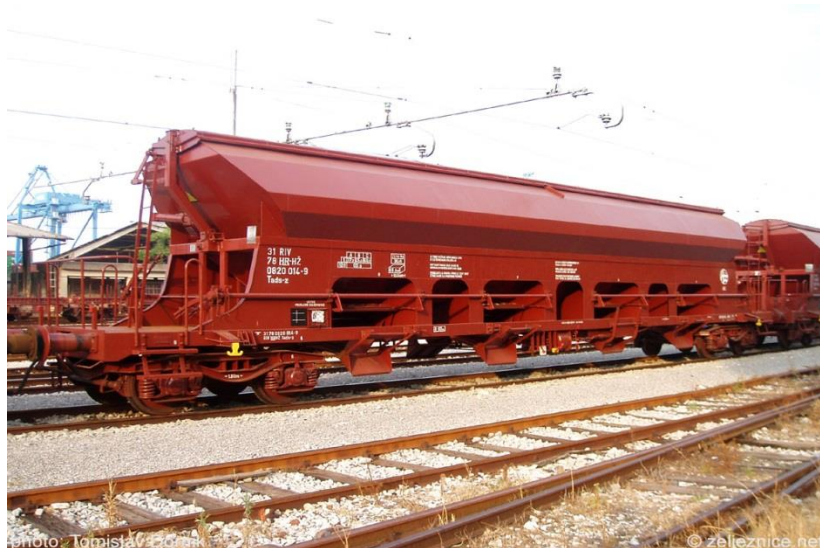
Slika 4.: Vagon serije T, podserije Tads